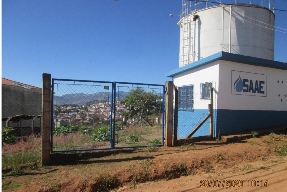
Fotografia 3 – Vista do portão de acesso ao local.