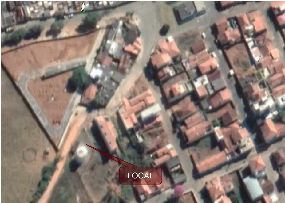
Fotografia 2 – Foto aérea do acesso ao local.