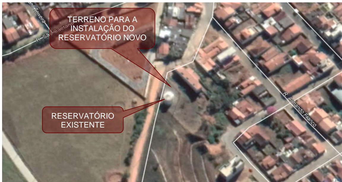
Fotografia 1 – Localização do terreno do reservatório R3, onde será instalado o reservatório novo.

3.5 - Diante disto, apontamos a necessidade de aquisição do reservatório, para melhorar a capacidade de reserva do sistema de abastecimento de água tratada, ajudando a suprir o aumento considerável do consumo de água da população de Cambuí.