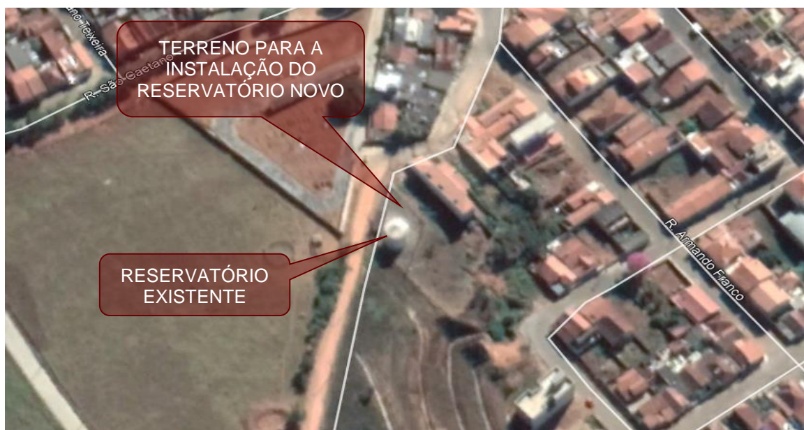
Fotografia 1 – Localização do terreno do reservatório R3, onde será instalado o reservatório novo.

3.5 - Diante disto, apontamos a necessidade de aquisição do reservatório, para melhorar a capacidade de reservação do sistema de abastecimento de água tratada, ajudando a suprir o aumento considerável do consumo de água da população de Cambuí.