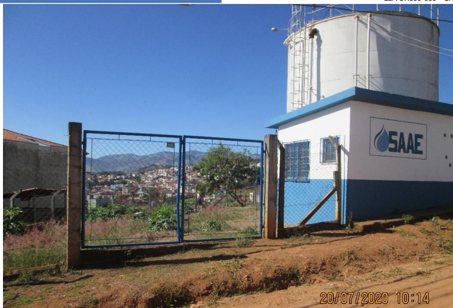
Fotografia 3 – Vista do portão de acesso ao local.