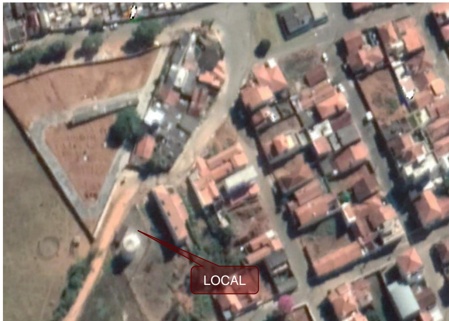
Fotografia 2 – Foto aérea do acesso ao local.